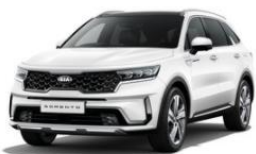
Snow White Pearl

*Billeder af sædebetræk og karosserifarverne er vejledende for bilens udseende og kan være vist med ekstraudstyr.