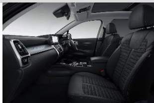
Prestige & Upgrade