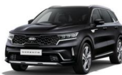
Aurora Black Pearl